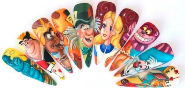
328 - Pintura plana 10 Tips Intermedio